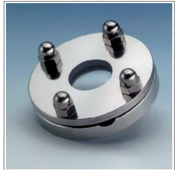
NA-Connect™ -Verbindung mit Metaglas Schauglas